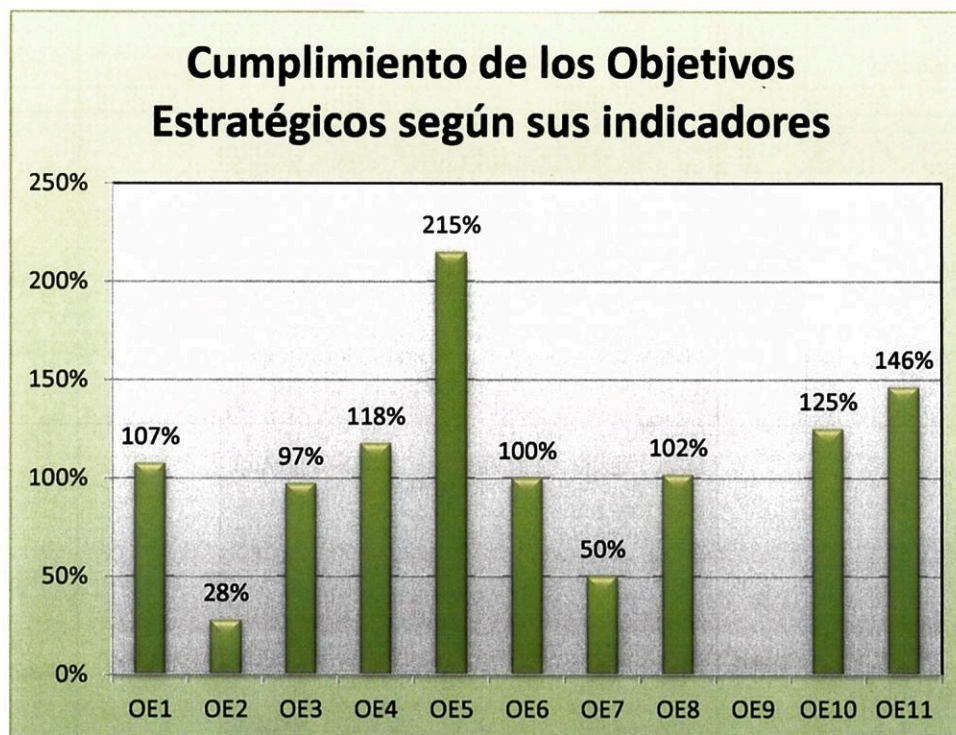
Gráfico N° 2

En el cuadro N° 2 se muestra el porcentaje promedio de Cumplimiento de los Objetivos Estratégicos de acuerdo a sus indicadores.